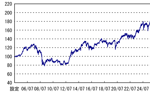
設定 06/07 08/07 10/07 12/07 14/07 16/07 18/07 20/07 22/07 24/07 ※横軸の目盛は該当月の月末を示します。